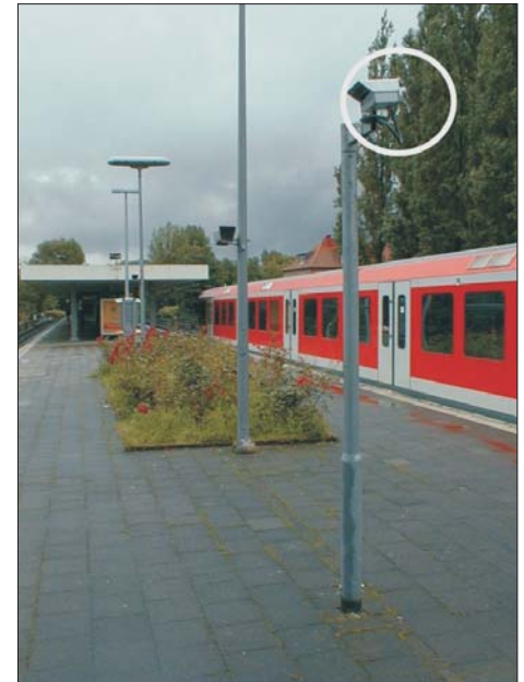
Infrarot - Präsenzdetektor FLG 10-20

Die Detektionsreichweite und Wirksamkeit der Hintergrundausbldung können vom Anwender in einem großen Bereich frei gewählt werden.