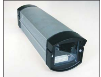
IVIS im IP 66 Gehäuse