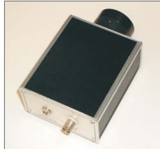
IVIS im IP 20 Gehäuse